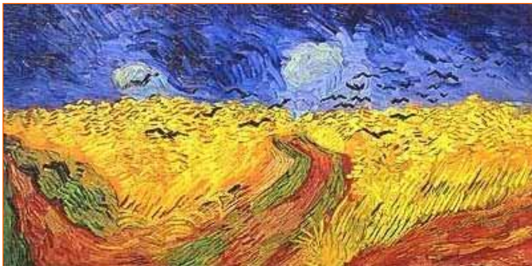
“Trigal con cuervos”, (1890), óleo sobre lienzo del pintor holandés, Vincent Van Gogh.

Este uno de los trabajos más conocidos de Van Gogh (1853-1890). En primer plano contemplamos el punto de unión de los tres caminos que parten hacia diferentes direcciones; entre ellos, limitados con una línea verde que corresponde con las hierbas y la maleza, hallamos los campos de trigo en todo su esplendor, iluminados por la luz nocturna que tanto atrajo a Vincent.