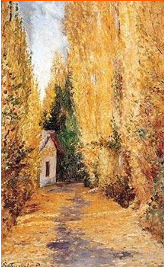
Calle de Concepción