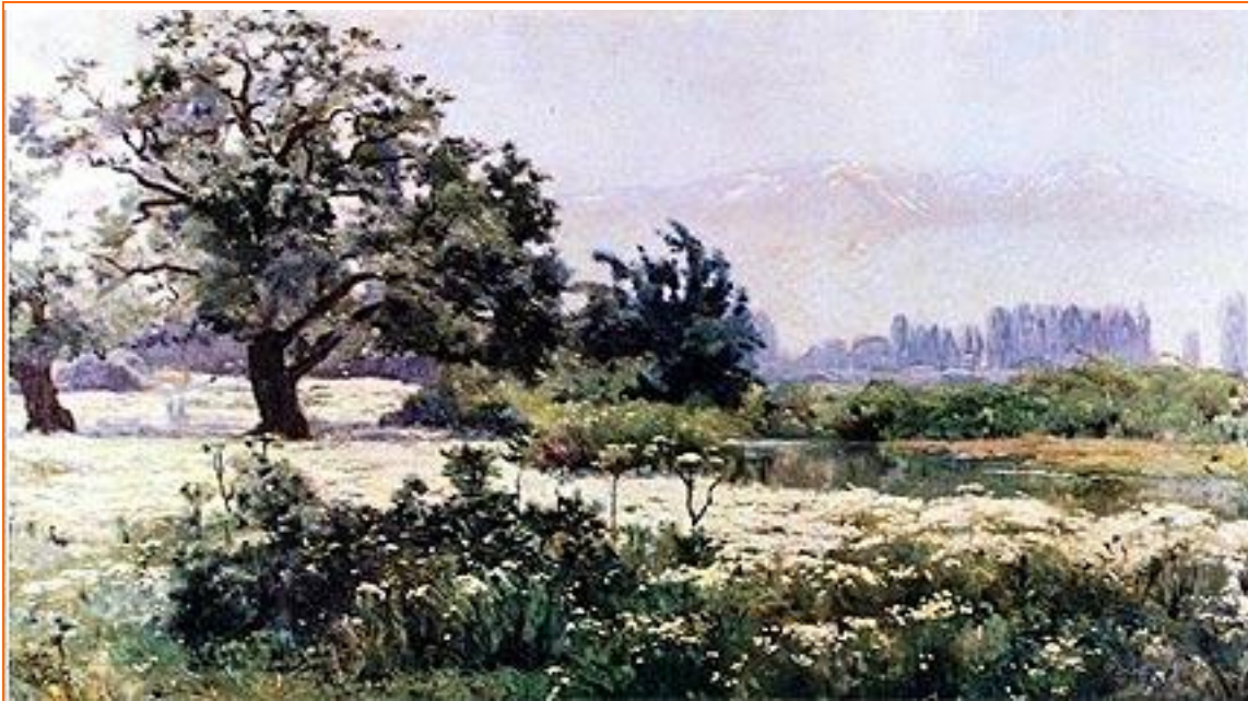
Paisaje con manzanillas