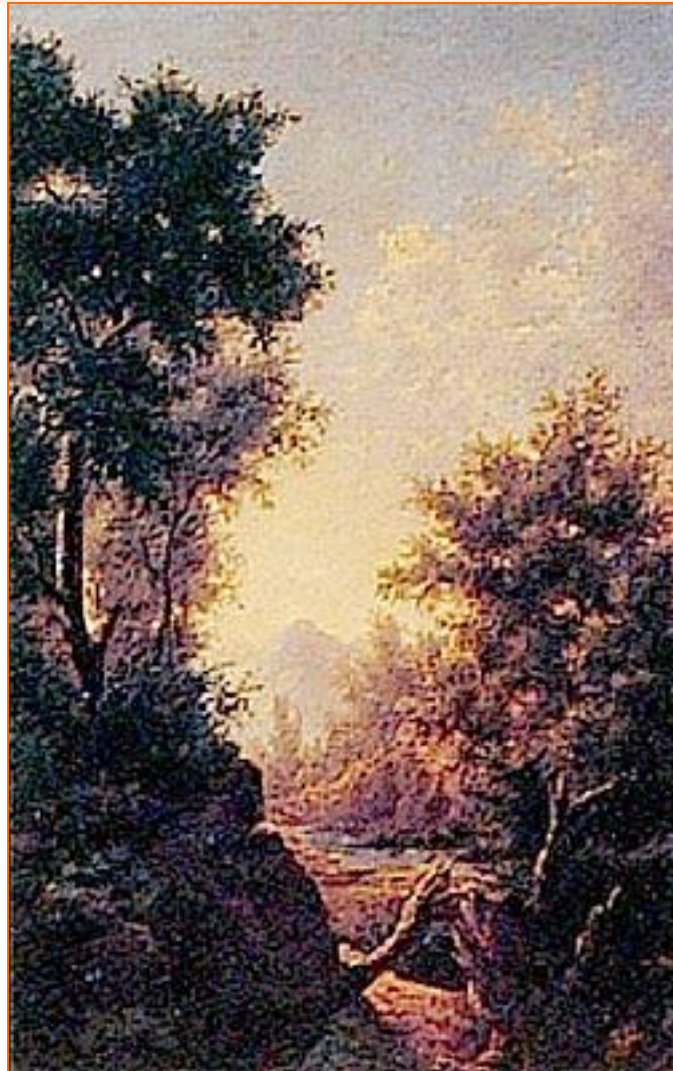
Paisaje, Autor: Pedro Lira Técnica: óleo sobre tela

La obra de Pedro Lira (1845-1912) fue influenciada por muchas de las corrientes artísticas europeas del siglo XIX. Con Paisaje se refleja el estilo romántico que viene a transgredir las estrictas normas de la composición academicista, para traspasar a la tela la subjetividad del artista.