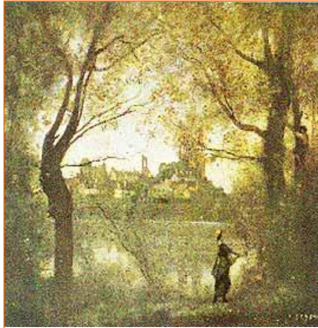
Paisaje de Mantes, (h.1830), óleo sobre tela de Camille Corot. Museo de Saint-Denis, Reims.

Jean Baptista Corot (1786 - 1875), pintor romántico francés, quien desarrolló mediante técnicas innovadoras un estilo de sutiles contrastes tonales que se hizo muy popular. Sus cuadros de atmósfera poética, por su tratamiento de color, composición y pincelada, muestran cercanía con la pintura impresionista de la década de 1870.