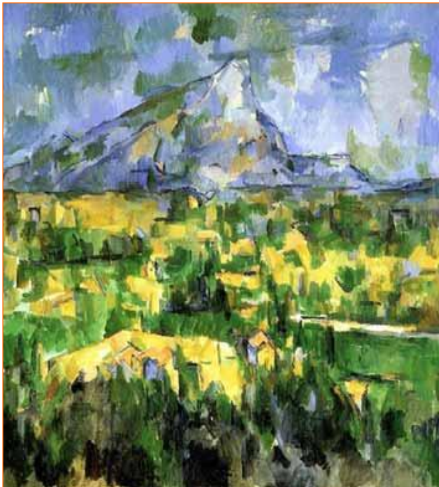
“Montaña Sainte-Victoire”, (1904-06), óleo sobre lienzo del pintor francés Paul Cezanne.

Con esta obra, Cèzanne se sitúa a un paso del Cubismo al emplear un facetado que más tarde utilizarán Braque y Picasso. La Montaña apenas es perceptible, confundiéndose con el cielo que la rodea mientras que las construcciones de sus faldas se han convertido en un maremagnum de rápidas pinceladas de diferentes tonalidades con las que se pretende crear formas y volúmenes. La línea ha desaparecido para dejar paso al color, aplicándose la teoría cezanniana de que "la forma alcanza sólo su plenitud cuando el color posee mayor riqueza".