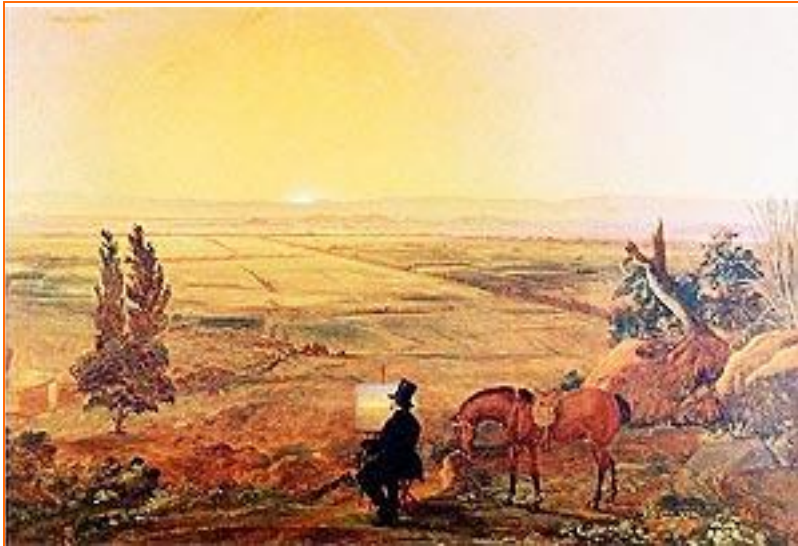
Vista de Santiago desde Peñalolén.