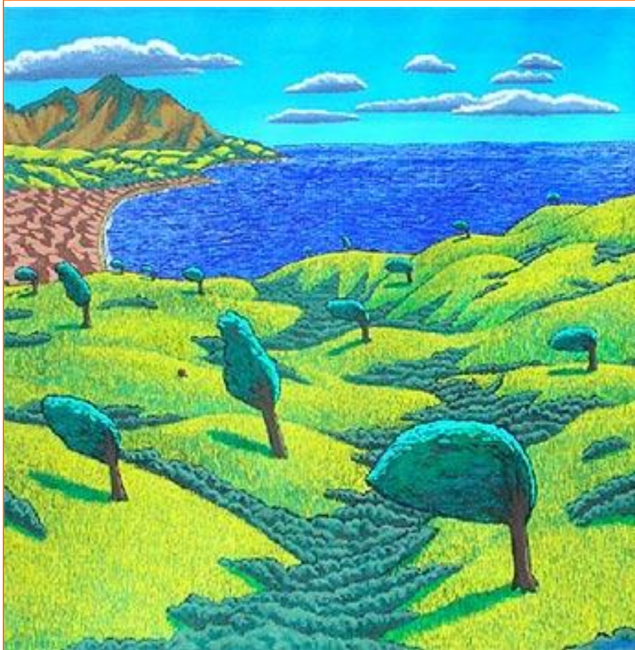
Árboles con viento